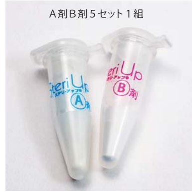
A剤 B剤 5セット 1組