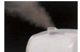
熱くない霧の超音波方式