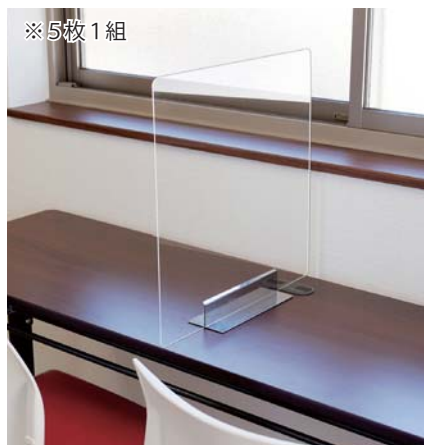
KH-771 ミニパーテーションセット (組) ¥23,100 (税別¥21,000) R

●材質=パネル:アクリル、ベース:ステンレス ●サイズ=45cm×45cm ●5枚1組●日本製