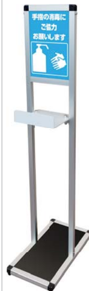
KH-772 消毒液スタンド (台) ¥16,500 (税別¥15,000) A

●材質=アルミ●重さ=3.2kg●サイズ=幅24.6cm×高121cm×奥46cm ●面板サイズ=28.1cm×19.4cm●A4ポスター付●日本製