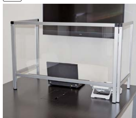
KH-768 3面パーテーション (台) ¥29,700 (税別¥27,000) A

●材質=フレーム:アルミ、パネル:アクリル ●サイズ=幅93.6cm×高68cm×奥46cm ●折りたたみ可●日本製