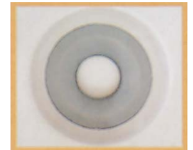
特殊加工超音波振動子